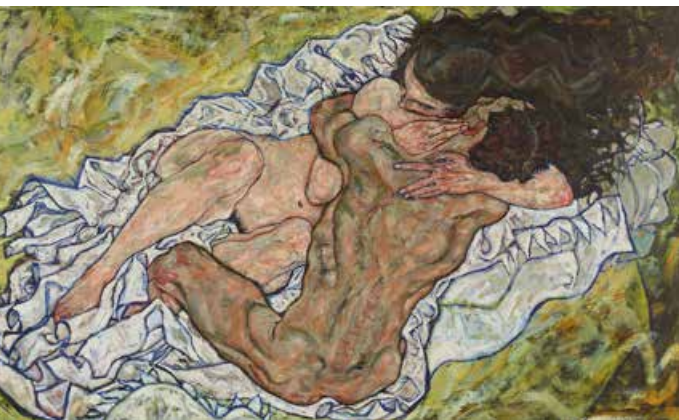
E. Schiele, Die Umarmung, 1917

In einer umfassenden Schau werden alle Arbeiten Egon Schieles, die in der Sammlung des Belvedere sind bzw. einmal waren, thematisiert. So wird die Genese einer Sammlung dargestellt. Zu sehen sind Highlights wie Eduard Kosmack, Bildnis Wally Neuzil, Hauswand, Tod und Mädchen, Die Umarmung oder Vier Bäume. Bereichert wird die Schau durch zahlreiche Leihgaben.